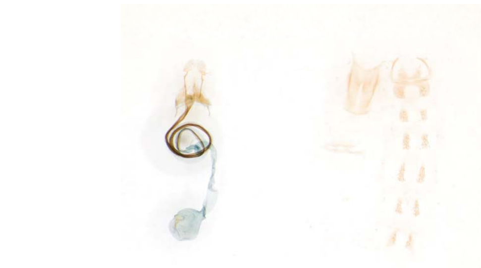
Abb. 3: weibliches Genitalpräparat GU 2315 von Coleophora cracella (Daten siehe Etikett Abb. 2 Mitte)